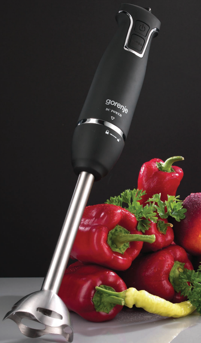
GORENJE HBX601QB ŠTAPNI MIKSER